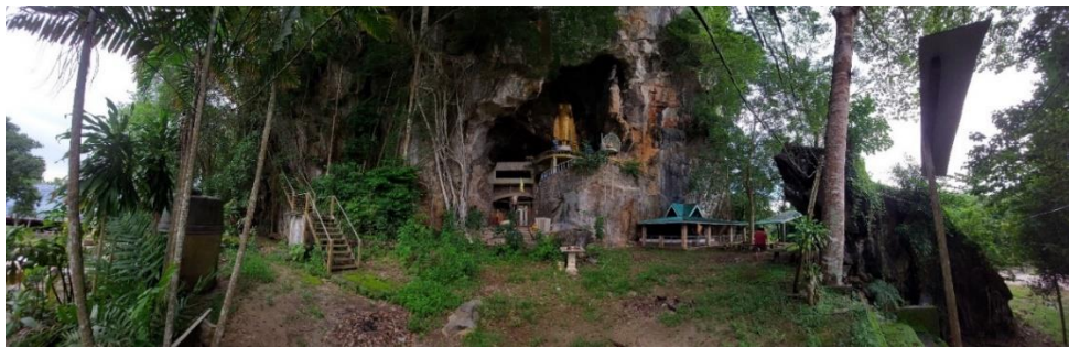
ภาพที่ 1 วัดถ้ำเขาจีนธีรประดิษฐ์