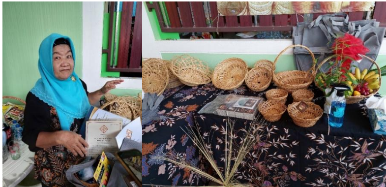
ภาพที่ 8 ช่างฝีมือดั้งเดิมงานจักสานก้านจาก ปารีณา บัวหอม

ปารีณา บัวหอม อายุ 58 ปี อาศัยอยู่ที่ 881 หมู่ 7 ซอย 15 ตำบลคลองขุด อำเภอเมืองสตูล จังหวัดสตูล จุดที่เริ่มทำคือเห็นหมู่ 3 เอาก้านจากทิ้ง ใช้งานเฉพาะใบจากนำมาผนเป็นยาสูบ จึงไปขอก้านจากมาทำผลิตภัณฑ์ต่าง ๆ ก้านจากที่สามารถไปขอได้อยู่ที่ หมู่ 1-4 หมู่ 7 มะสอนให้ฟรี เลี้ยงข้าวด้วยแต่ไม่มีใครมาทำ การนำก้านจากมาใช้แล้วมาทำเป็นผลิตภัณฑ์กระจายใส่สิ่งของเป็นการใส่ใจต่อสิ่งแวดล้อมและระบบนิเวศ และทำให้เกิดมูลค่าเพิ่มรายได้ให้ครัวเรือน นอกจากนั้นการลอกใบจากออกจากก้านจากยังสามารถนำไปทำปุ๋ยได้อีกด้วย (ปารีณา บัวหอม, สัมภาษณ์วันที่ 5 พฤษภาคม 2565) มีคุณค่าด้านการศึกษา การสืบทอดการจักสานหัตถกรรมพื้นบ้าน