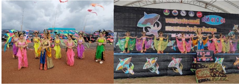
ภาพที่ 11 ระบำว่าวควายในพิธีเปิดงานว่าวประเพณีวันที่ 28 กุมภาพันธ์ 2565

ศิลปะการแสดงระบำว่าวควายแนวชนบ นักเรียนและครูที่สอนนาฏศิลป์โรงเรียนสตูลวิทยาได้คิดค้นท่ารำระบำว่าวควาย เพื่อใช้ในวันสำคัญของงานประเพณีว่าวสตูลในทุกปี ระบำว่าวควายเป็นการแสดงของท้องถิ่นที่จัดประกอบในงานประเพณีว่าวสตูล ที่เป็นเอกลักษณ์เฉพาะถิ่นจังหวัดสตูล ซึ่งจัดเป็นภูมิปัญญาด้านศิลปะการแสดง มีความโดดเด่นทั้งท่ารำและเครื่องแต่งกาย (พงศศักดิ์ คงสง, สัมภาษณ์ วันที่ 9 มิถุนายน 2565)