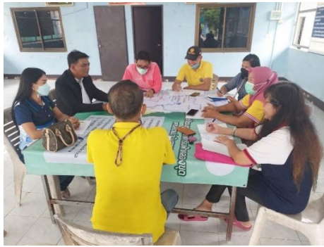
ภาพที่ 18 การตรวจสอบแผนที่วัฒนธรรมชุมชนริมฟ้าคลองซุดเป็นรายกลุ่ม