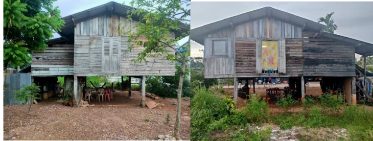
ภาพที่ 3 บ้านพื้นถิ่นดั้งเดิม หมู่ 1