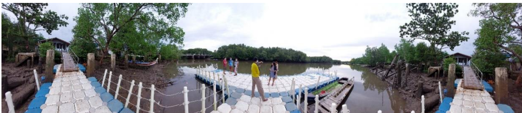
ภาพที่ 2 ท่าเรือบ้านเกาะนก

ท่าเรือบ้านเกาะนก ตั้งอยู่ที่หมู่ 3 เป็นท่าเรือสำหรับรับส่งนักท่องเที่ยวไปเกาะตะรุเตาในอดีต เป็นนักท่องเที่ยวการเมือง สร้างในปี 2496 และเป็นคลองที่เชื่อมไปยังทะเลได้ เป็นน้ำกร่อย มีป่าชายเลนอุดม