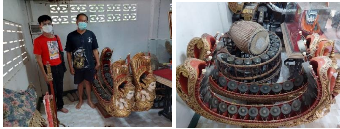
ภาพที่ 13 ครูวิศิษฐ์กับเครื่องดนตรีที่ศูนย์เรียนรู้ดนตรีไทย

(ครูวิศิษฐ์ ม่วงปลอด, สัมภาษณ์วันที่ 25 มีนาคม 2565) หลังจากเกษียณปี 2562 เริ่มสอนดนตรีไทยที่บ้านในปี 2562-2564 เป็นประธานชุมชน ต้องการเห็นคนในชุมชนได้มีความรู้ และจรรโลงใจในการดนตรี จึงเปิดสอนดนตรีไทยที่บ้าน จำนวนผู้เข้าเรียนรุ่นละ 20 คน สอนผู้ใหญ่ วันจันทร์-วันศุกร์เวลา 18.00-20.00 น. กลุ่มเด็กเยาวชนสอนวันเสาร์อาทิตย์ เวลา 9.00- 10.00 น. ค่าเรียนเดือนละ 200 บาท โดยนำค่าเรียนมาซื้อขนม และน้ำสำหรับเลี้ยงคนที่มาเรียน ผลงานเหล่านี้ที่สร้างขึ้นได้ความสบายใจ ความสุขใจ และได้รับรางวัลโล่เกียรตินิยมจากกระทรวงวัฒนธรรม ด้วยการนำนักเรียนไปประกวดการเล่นดนตรีไทย