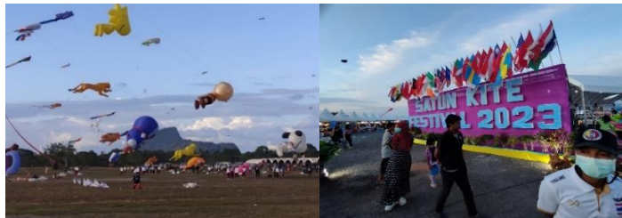
ภาพที่ 14 งานว่าวที่มีการแข่งขันว่าวขึ้นสูง

การแข่งขันกีฬาว่าวควายในงานประเพณีว่าวสตุล ปัจจุบันครั้งที่ 42 จัดขึ้นในช่วงเดือนกุมภาพันธ์ เนื่องจากมีลมว่าว มีผู้เข้าร่วมแข่งขันหลายประเทศและหลายภูมิภาค มีการแข่งขันว่าวขึ้นสูง กติกาการแข่งขันคือ ว่าวที่ชักขึ้นพร้อมกัน ว่าวตัวไหนที่ชักขึ้นสูงทำมุม 90 องศา กับพื้นดินได้ก่อน ว่าวตัวนั้นก็จะชนะ โดยนิยมแข่งขันครั้งละ 2 ตัว (เวียง ตั้งรุ่น, สัมภาษณ์วันที่ 26 มีนาคม 2565)