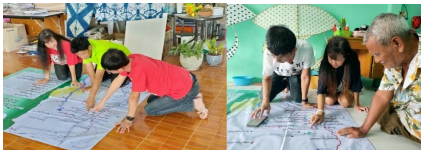
ภาพที่ 17 การนำแผนที่ฉบับร่างไปให้ผู้ให้ข้อมูลให้ข้อเสนอแนะเป็นรายคน

5. นำแผนที่วัฒนธรรมที่เจ้าของวัฒนธรรมและผู้มีส่วนได้ส่วนเสียร่วมกันวิพากษ์และปรับแก้แล้วนำไปกรอกในระบบฐานข้อมูลของทีมกลาง บพท. Google mapping เพื่อเผยแพร่สาธารณะ (Going public)